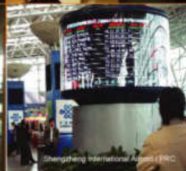
Shengzheng International Airport / PRC