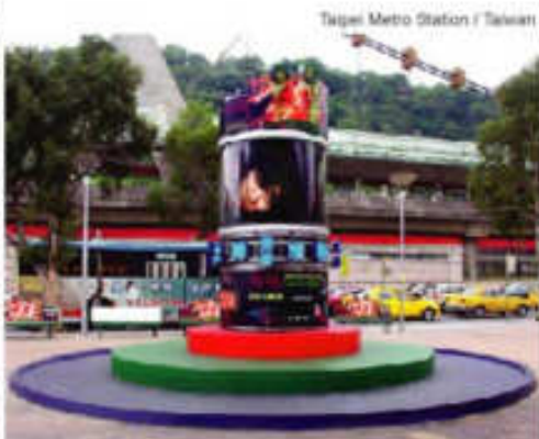
Taipei Metro Station / Taiwan

Живописни, подвижни и интересни картини на Darlux Image LED видео дисплей привличат вниманието на минувачите на публични места. Благодарение на ефективността на Darlux Image Led видео екран може да рекламирате разказвайки историята на даден продукт, анонсирайки промоции, предстоящи събития и всякакви други услуги във фоайета на молове, търговски центрове, хотели и т.н. Освен това, е много подходящо да имате инсталиран Darlux Image дисплей във фоайето на вашата компания, който да гради вашата корпоративна идентичност и допълва вашия имидж. Също така е подходящ за филмови промоции във фоайета на кино-салони, където посетителите ще могат да се осведомят за съдържанието, актьорския състав и премиерата на даден филм.