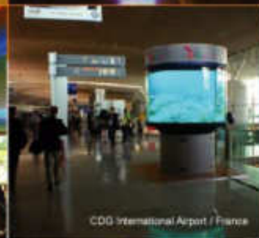
CDG International Airport / France