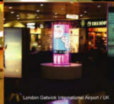
London Gatwick International Airport / UK