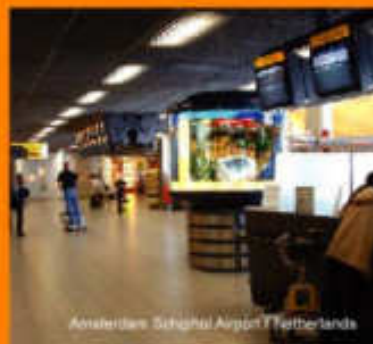
Amsterdam Schiphol Airport / Netherlands