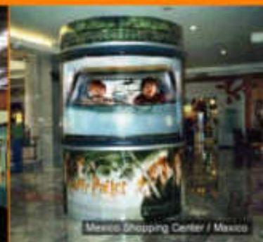
Mexico Shopping Center / Mexico