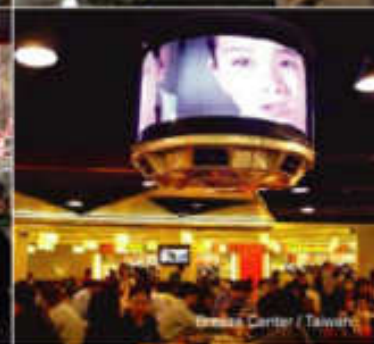
Shopping Center / Taiwan