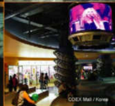
COEX Mall / Korea