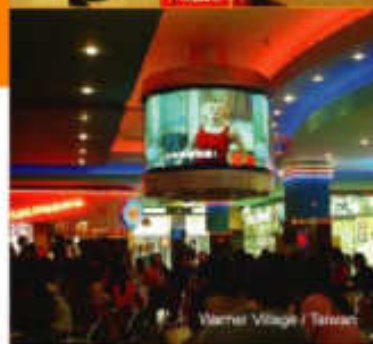
Warner Village / Taiwan