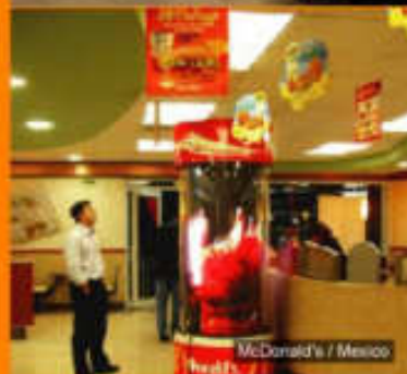
McDonald's / Mexico