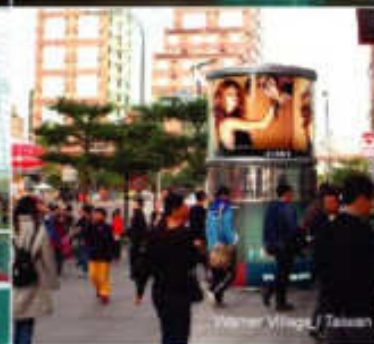
Warner Village / Taiwan