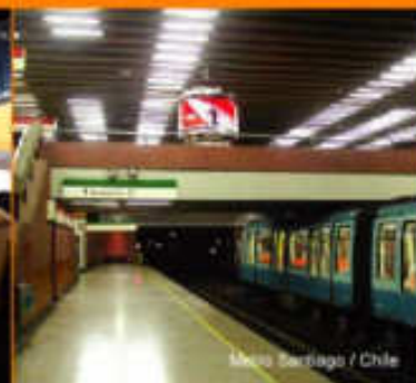
Metro Santiago / Chile