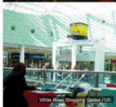
White Swan Shopping Center / PRC