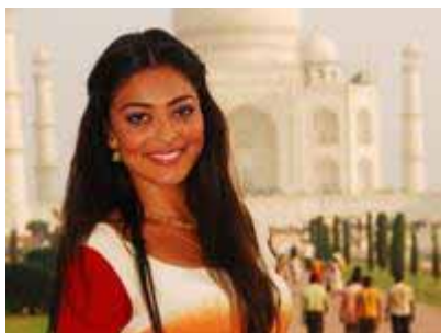
Майа /Жулиана Паеш/

Обявена за най-красива жена от списание PEOPLE за 2006 г. Номинирана за най-сексапилната жена в света от мъжкото списание VIP през 2007 г. Топ модел и актриса - една от най-влиятелните жени в Бразилия.