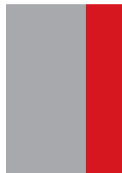
1/3 СТРАНИЦА обрязан размер 62,5/275 mm необрязан размер 67,5/285 mm