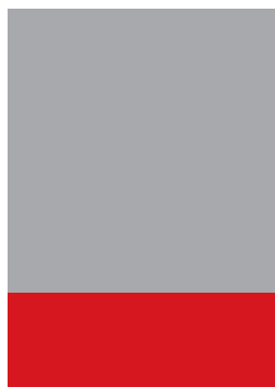
1/4 СТРАНИЦА обрязан размер 205/66,5 mm необрязан размер 210/71,5 mm