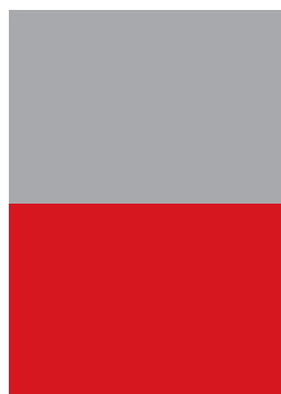
1/2 СТРАНИЦА обрязан размер 205/137,5 mm необрязан размер 210/142,5 mm