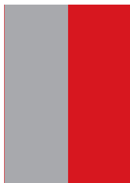
1/2 СТРАНИЦА обрязан размер 100/275 mm необрязан размер 105/285 mm