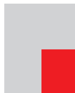
1/4 страница необр: 118 mm x 152.5 mm обр: 113 mm x 147.5 mm