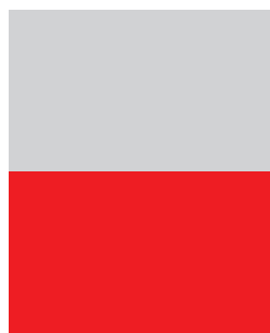
1/2 страница необр: 238 mm x 152.5 mm обр: 230 mm x 147.5 mm