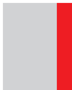
1/4 страница необр: 59 mm x 305 mm обр: 54 mm x 295 mm