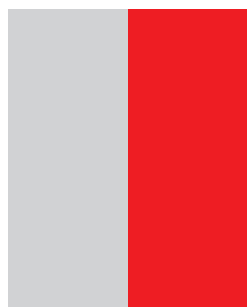
1/2 страница необр: 118 mm x 305 mm обр: 113 mm x 295 mm